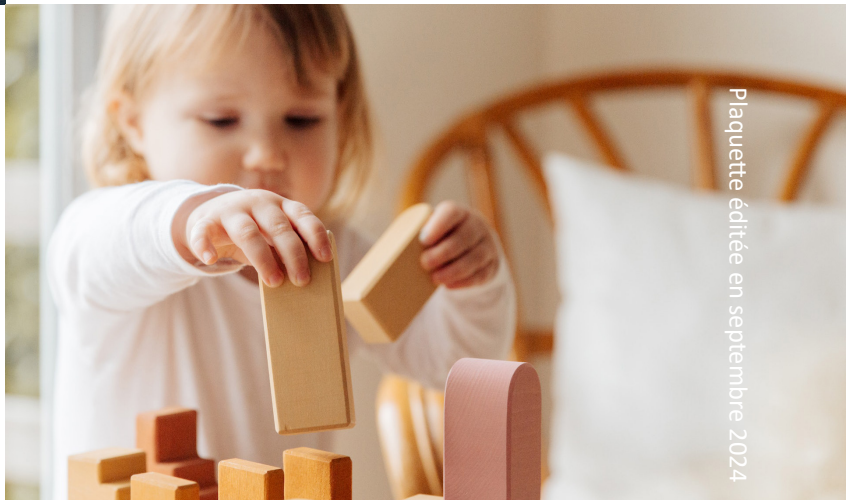
Plaquette éditée en septembre 2024

2 100 emplois d'éducateur de jeunes enfants dans le Grand Est *